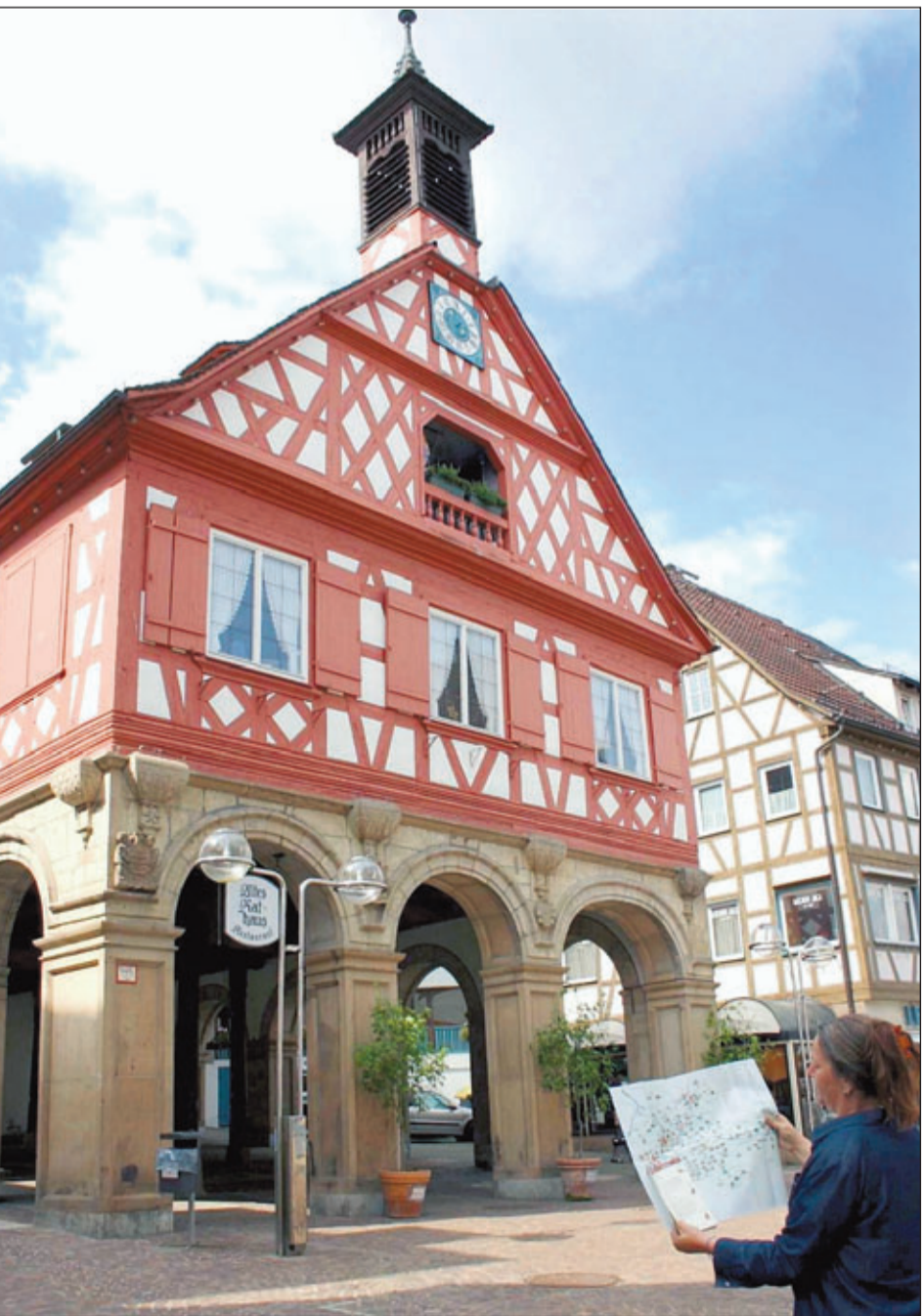
Immer eine Reise wert: Waiblingen und seine zahlreichen Sehenswürdigkeiten, hier das Alte Rathaus am Marktplatz.

Im Internet: www.spd-waiblingen.de . Helmut Fischer