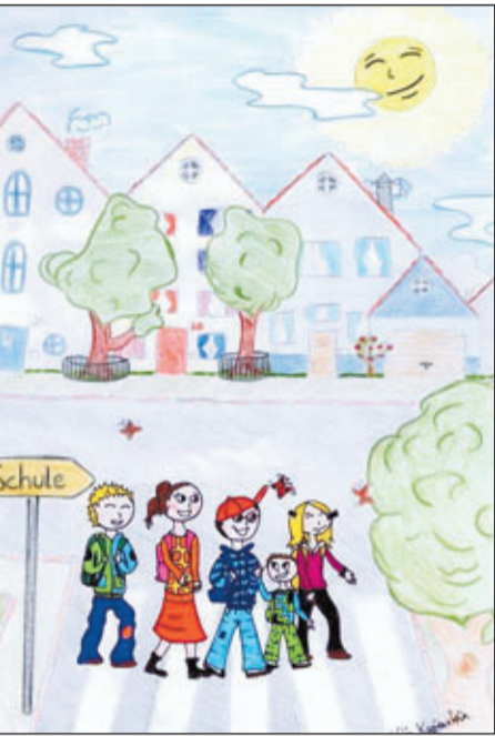
„Zu Fuß zur Schule!“ ist die Devise im neuen Schuljahr. Für das Projekt „Waiblinger Tausendfüßler“ hat Katja Kapfenstein, Schülerin an der Wolfgang-Zacher-Schule, dieses einladende Bild gezeichnet.

„Waiblinger Tausendfüßler“ krabbelt nach den Sommerferien flugs los – Gegen den Bewegungsmangel und das Aufmerksamkeits-Defizit-Syndrom