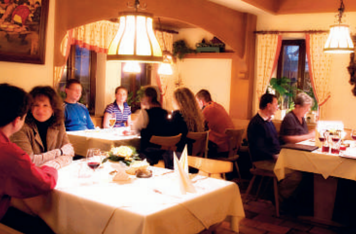
Hotel Restaurant Krone in Waiblingen-Bittenfeld