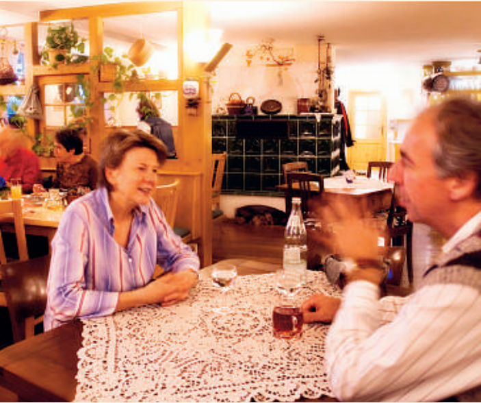
Café Kuhstall in Waiblingen-Hegnach