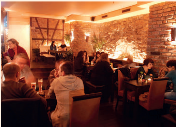
Turmbar am Beinsteinertor in Waiblingen-Mitte