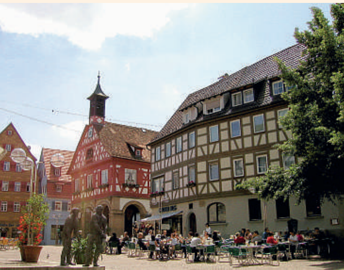
Altes Rathaus in Waiblingen-Mitte