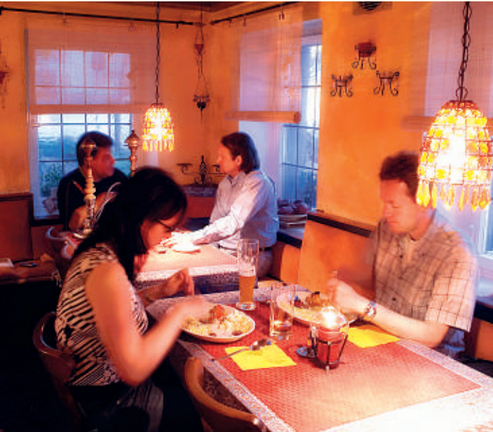
Restaurant Lezzat in Waiblingen-Mitte