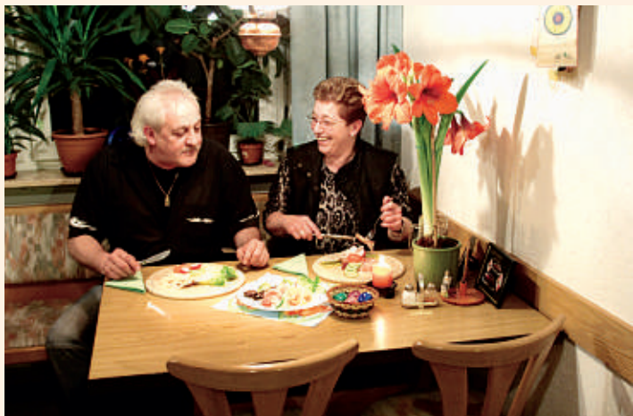
Vereinsheim des SSV in Waiblingen-Hohenacker

Das mitten im Wald gelegene Vereinsheim des SSV hält für seine Gäste traditionell-schwäbische Vesper bereit. Die Räumlichkeiten können angemietet werden, ebenso der hauseigene Grill.