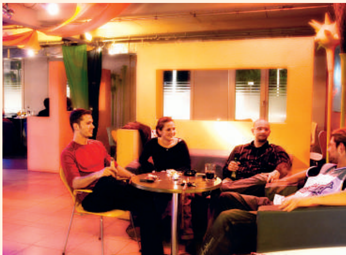
Kulturbar Luna in Waiblingen-Mitte