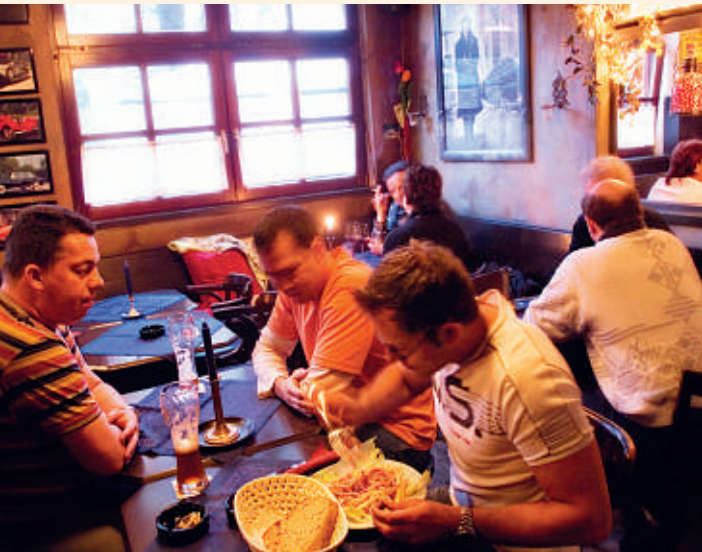
Bistro Lindenstraße in Waiblingen-Mitte

14 🚗 Blumenstraße 🕒 Mo-Do 11-24, Fr 11-1, Sa 17-1, So 17-24 Uhr