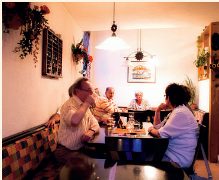
S'Mariensträßle in Waiblingen-Mitte

Hier findet der Schwabengaumen, wonach er sucht: Maultaschen, Spätzle, Fleischküchle und vieles mehr. Denn schwäbische Küche wird in diesem gemütlichen Lokal groß geschrieben. Zudem gibt es täglich ein preiswertes Mittagsgeschicht, zwischen 4 Euro und 4,50.