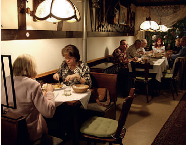
Restaurant Falken in Waiblingen-Mitte