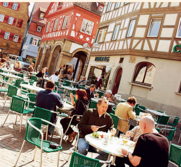
Café Tagblatt in Waiblingen-Mitte

schen Leckereien gut aushalten. Der ideale Platz, um nach den Besorgungen in der Stadt zu entspannen.