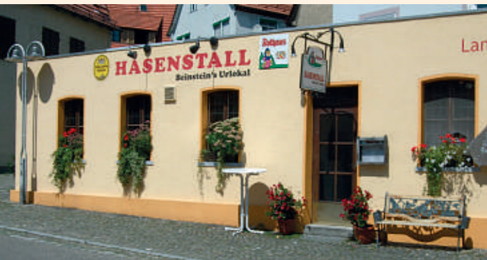
Hasenstall in Waiblingen-Beinstein