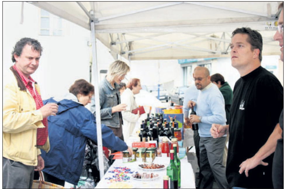
Auch Spezialitäten aus Waiblingen wurden auf dem Mayenner Markt angeboten, darunter das „Ratströpfle“, der Apfelsaft oder Pferdewurst.