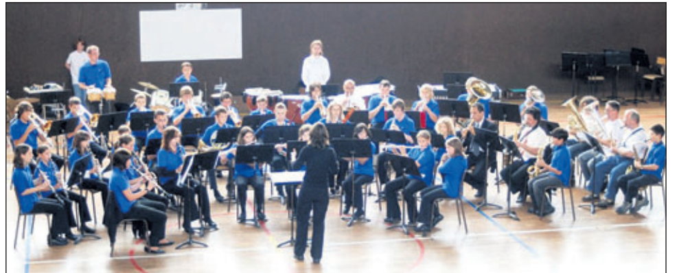
Musik verbindet ebenso...