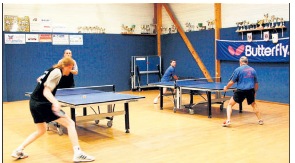
Auch Tischtennis-Wettkämpfe wurden ausgetragen.