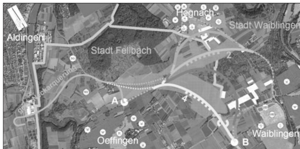
Die Verlängerung der Westumfahrung und Südtangente Hegnach aus der Verkehrsuntersuchung 2007.

„Planungen nicht zustimmungsfähig“ Er lehne den Antrag der Stadtverwaltung ab, machte BüBi-Rat Horst Jung deutlich, und schließe sich in allen Aussagen denen der SPD-Fraktion an. Die Planungen des Regierungspräsidiums seien nicht zustimmungsfähig und für Hegnach unzumutbar. Es gehe hier nur noch um Zahlen, die Natur habe keine Lobby mehr. Die Straße zerteile die Landschaft und mache sie kaputt. Wir alle sollten begreifen, forderte Jung, dass vermeintliche Zwänge für