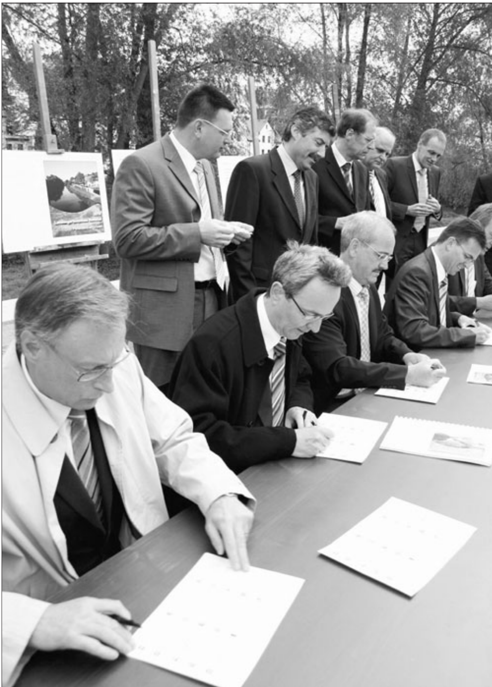
15 Städte und Gemeinden haben sich dazu entschlossen, im Jahr 2018 gemeinsam eine Landesgartenschau Remstal auf die Beine zu stellen – vorausgesetzt, ihre Bewerbung wird vom Land akzeptiert. Am 29. Mai haben die Oberbürgermeister und Bürgermeister an den Waiblinger Remsterrassen den entsprechenden Vertrag unterzeichnet.