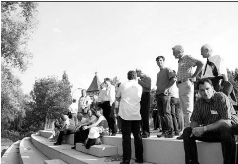
Korber und Waiblinger Gemeinde- und Stadträte hatten schon im Sommer 2007 einmal zur Probe auf den Remsterrassen Platz genommen.

Mit dem Landes-Familienpass durchs ganze Land – Erhältlich im Bürgerbüro Waiblingen