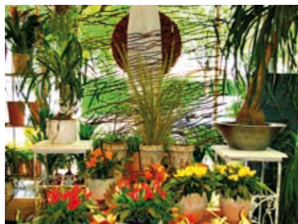
Geschäft Blumen Lent