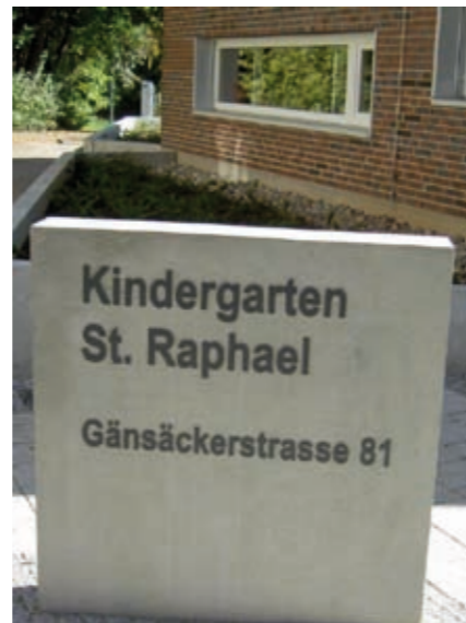
Der Kindergarten St. Raphael erstrahlt in neuem Glanz - im Oktober wurde das mit einem Fest gefeiert.