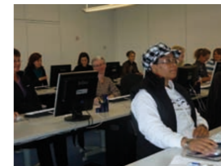
Gut besuchter PC-Kurs