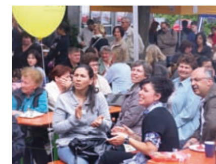
Feststimmung auf dem Danziger Platz 2010

Sternsinger besuchen Familien und singen von der Weihnachtsbotschaft am 1./2. und 6. Januar 2011. Wenn Sie die Sternsinger empfangen möchten, ist eine Bestellung telefonisch unter 07151 / 905709 bis Mittwoch, 29. Dezember möglich.