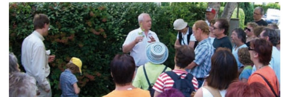
Großes Interesse der Besucher bei der Heilkräuterwanderung

Während der eineinhalbstündigen Wanderung wurden insgesamt 64 Heilpflanzen entdeckt, ihre Wirkung erklärt und auf die Verwendung in Fertigarzneimitteln oder in der Homöopathie hingewiesen. Besonders wurde auf Giftpflanzen wie Maiglöckchen, Digitalis, Ginster und Oleander verwiesen, die alle nur als Fertigarzneimittel zur Anwendung kommen und nicht als Tee Verwendung finden. Auch Pflanzen, die im Grunde genommen jeder kennt, die