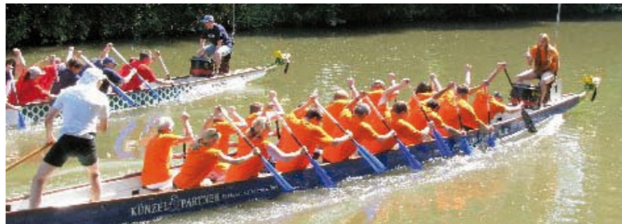
Eindrücke vom Drachenbootcup... Die Mannschaft belegte einen achtbaren 17. Platz von über 50 Teilnehmern. Gratulation Allen, die zu diesem Erfolg beigetragen haben.